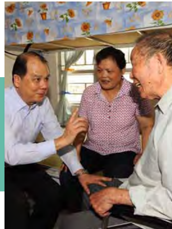
■ 張建宗（左一）去年探訪觀塘區的長者

1999年出任勞工處處長時，為推動職業安全，政府強制地盤工人參加基本安全訓練課程，考取「平安咭」，當時業界反應不一，他決定親自了解情況。