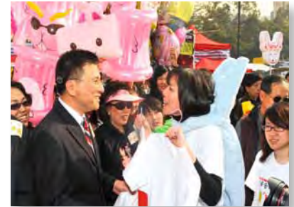
■ 陳家強 2011年到維多利亞公園年宵市場，為實踐創業計劃的年輕人打氣

小時家住彩虹邨，家境一般，今天當上教授、大學院長和政府官員，陳家強相信成功其實有很多方法，遇到困難可想想其他較簡單的方法，最重要的是做自己喜歡而擅長的，這樣最後總會成功。