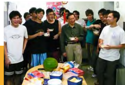
■ 2008年張炳良(中)履任香港教育學院校長後探訪該校宿生