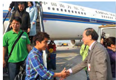
■ 2011年1月政府派專機接載因埃及發生動亂滯留於該國的港人，黎棟國（右）在機場迎接返港旅客

前年十二月，歐洲大風雪，在英國留學的香港學生被迫滯留倫敦機場，有家長要求政府協助孩子回港。黎棟國也很為孩子擔心，除了與航空公司商量航班問題，更請對方容許非該公司乘客的港澳學生，入住他們臨時租用的酒店宴會廳。當時卻也有人批評政府不應為這批學生大費周章。