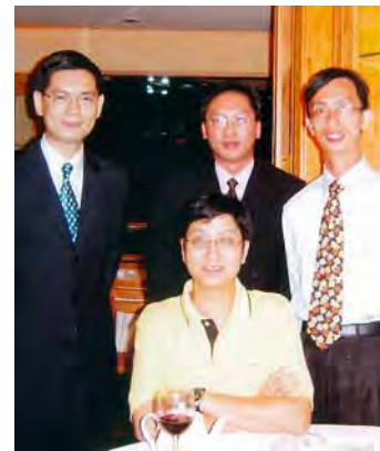
■ 袁國強（後排中）與當年在香港大學學生宿舍住宿時結識的友人合照

那些年的歲月，由「屋邨仔」到「大狀」到「律政司司長」，袁國強一直過得很滿足，永遠記得自己來自基層。誠然，沒有昔日，哪有今天！