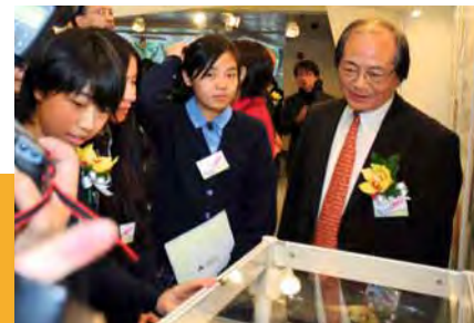
■ 吳克儉（右）2011年初出席香港考試及評核局主辦的資訊日活動，向學生講解有關資料

待人處事，他以「處事不可不公」6個字為他的座右銘，堅持公平處理的原則，甚得同事好評。