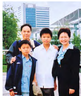
■ 林鄭月娥 2004 年調任香港駐倫敦經濟貿易辦事處時，與家人在當地合照

做公務助人的想法，始於林鄭的求學時期。大學畢業找工作，她沒有申請過私人機構職位，一心要加入政府做公職。林鄭相信，自己既不崇尚物質主義，又沒有「搵大錢」心態，再加上小時候年年做風紀，培養出為人排難解紛的正義感，早已註定「一生要為公眾服務」的人生路。