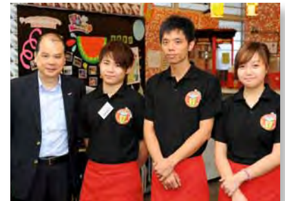
■ 張建宗（左一）與參加就業協助計劃的青年交流

張建宗一身便服，走進建造業訓練局的課室，和二十六名地盤工友一起上課。他皮膚白皙，工友一眼就看穿他不是「行內人」，但是大家相處融洽，一起吃「牛腩飯」，暢所欲言。工友告訴他，課程很實用，可以溫故知新，他知道走對方向。