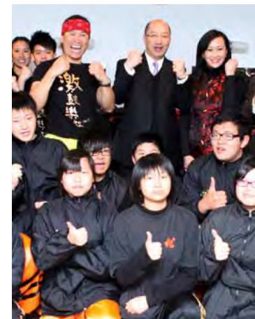
■ 譚志源（後排中）和太太（後排右一）出席活動時與表演者合照。

全力支持推出長者兩元乘車優惠。他說：「如果老人家可以用優惠價錢乘車，對他們的身體和社交生活都有好處，政府就是要幫助這些有需要的人。」結果優惠在相關政策局和部門的努力下推出，他高興之餘，對在政府工作可以為市民服務，有了更深的體會。