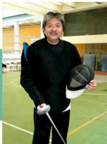
■ 曾俊華是劍擊高手，從中領悟不少人生哲理

這個道理放諸四海皆準。比如在官場，曾俊華堅守武德的精神，尊重不同意見，勇於接受批評，即使捱打也不怕；做教練，教導青少年劍術，曾俊華從不罵徒弟，尊重不同學生的看法，因應各人性格教劍；