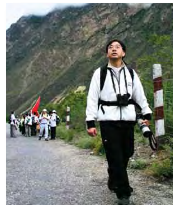
■ 高永文參加苗圃行動步行籌款活動，幫助貧苦兒童重返校園

高永文和醫護界關係融洽，在醫務和公職崗位上服務多年，發揮所長，亦經常扶助弱小。他多次為苗圃行動步行籌款，足跡遠至雲南、西雙版納等偏遠地方，在旅途中幾經艱險，只為幫助貧苦兒童重返校園。他相信越弱小的越需要幫助，所以，除了服務香港紅十字會這類大型慈善機構外，還積極協助中小型志願機構，包括再生會和香港防癌會等。