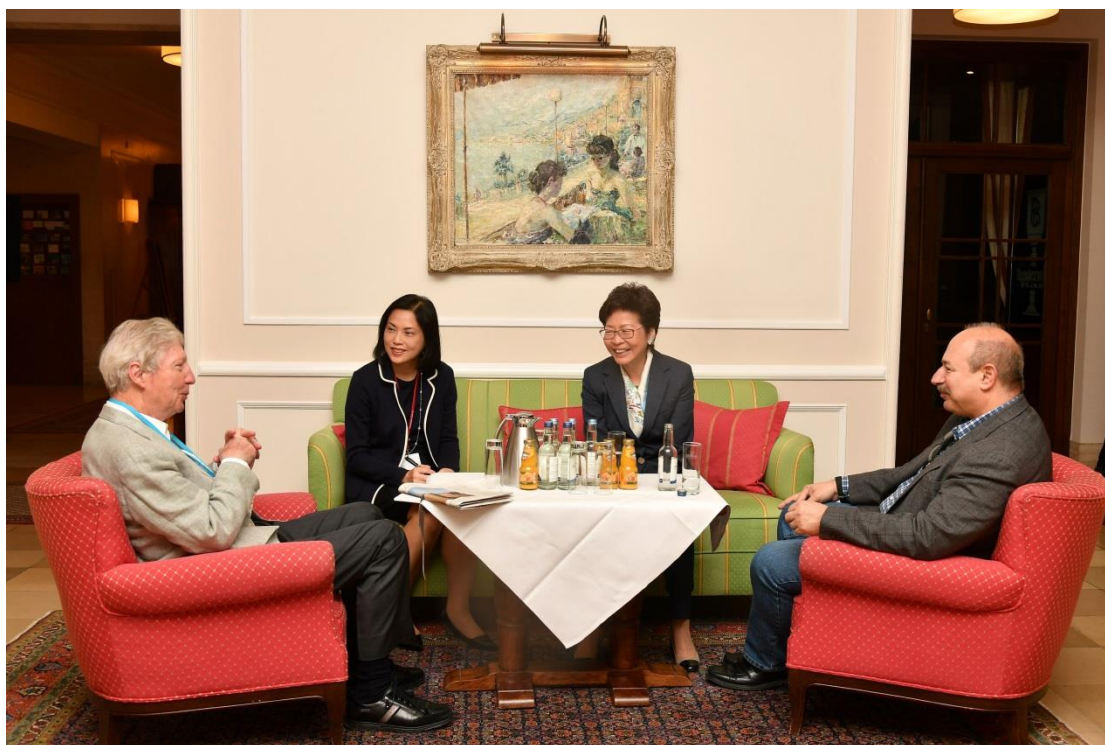
我在林道期間亦與另外兩位同時獲得諾貝爾獎和邵逸夫獎的學者 - Bruce Beutler 教授(右一)和 Jules Hoffmann 教授(左一) 見面。