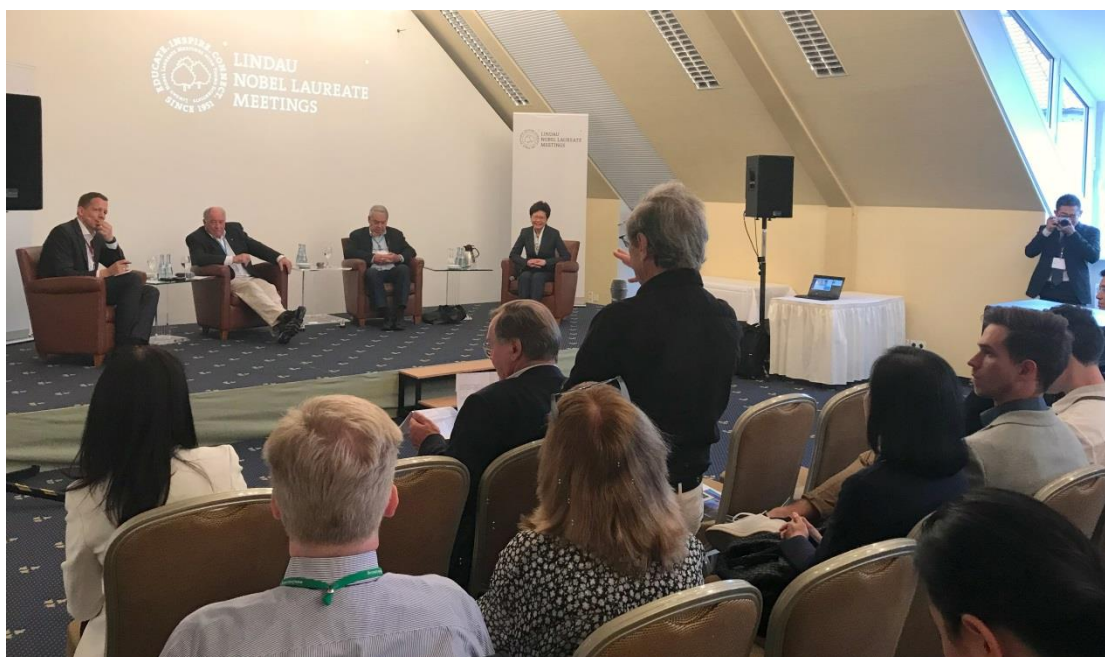
2018年6月，我與諾貝爾獎得主 Ferid Murad 教授（左三）和 Kurt Wüthrich 教授（左二）在第 68 屆林道諾貝爾獎得主大會的研討會中與青年科學家交流。