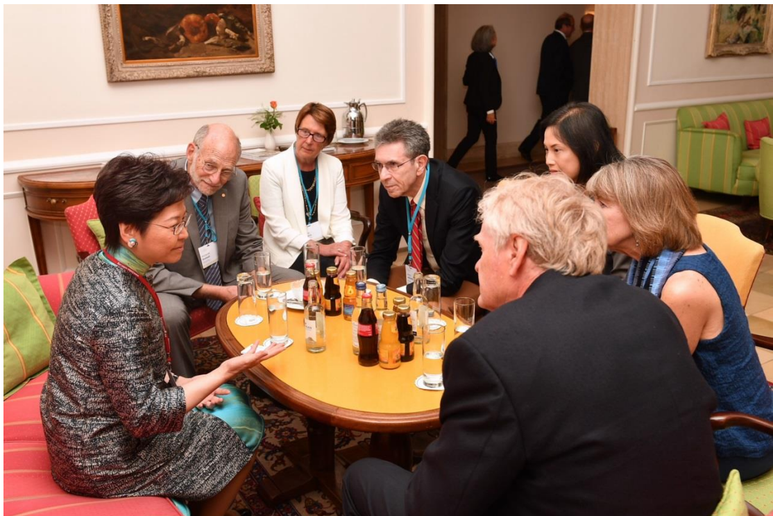
我在林道與同時獲得諾貝爾獎和邵逸夫獎的學者 Michael Rosbash 教授（左二）、Michael Young 教授（我的右邊）和 Robert Lefkowitz 教授（左四）見面。