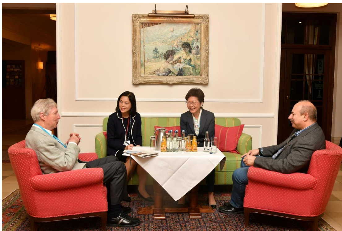
我在林道期间亦与另外两位同时获得诺贝尔奖和邵逸夫奖的学者 - Bruce Beutler 教授(右一)和 Jules Hoffmann 教授(左一) 见面。