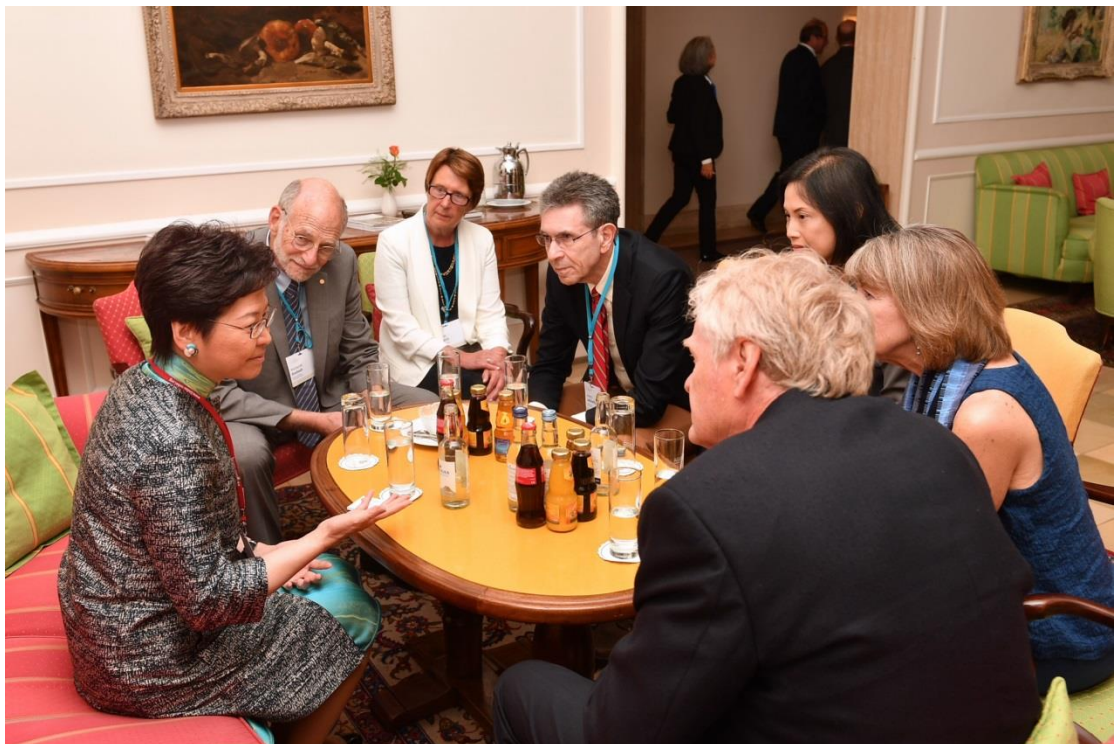
我在林道与同时获得诺贝尔奖和邵逸夫奖的学者 Michael Rosbash 教授（左二）、Michael Young 教授（我的右边）和 Robert Lefkowitz 教授（左四）见面。