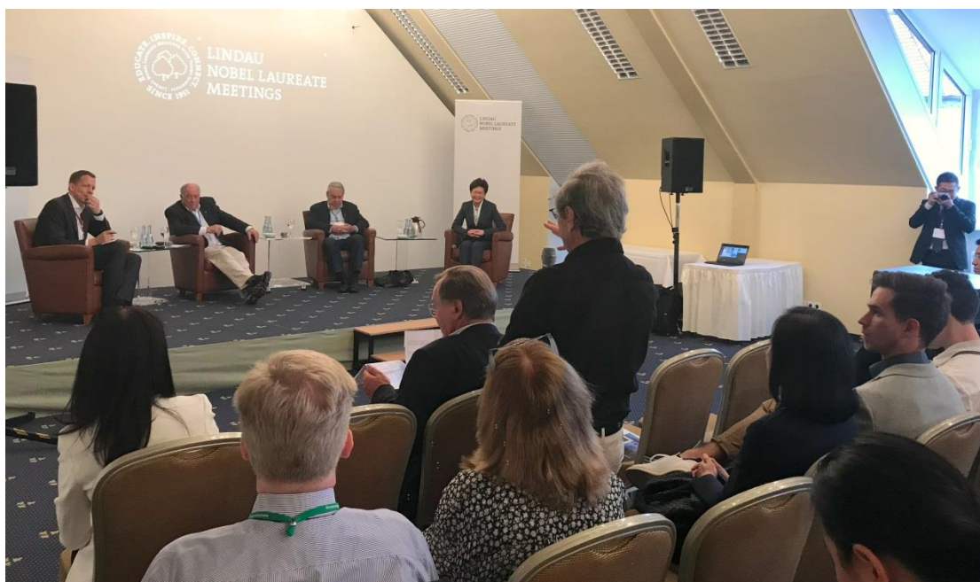
2018年6月，我与诺贝尔奖得主 Ferid Murad 教授（左三）和 Kurt Wüthrich 教授（左二）在第68届林道诺贝尔奖得主大会的研讨会中与青年科学家交流。