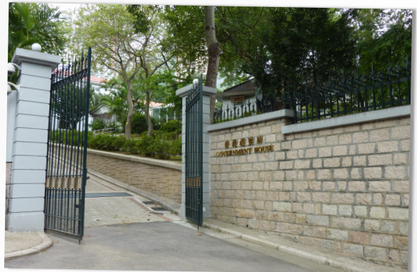
請於上亞厘畢道香港禮賓府東閘進入